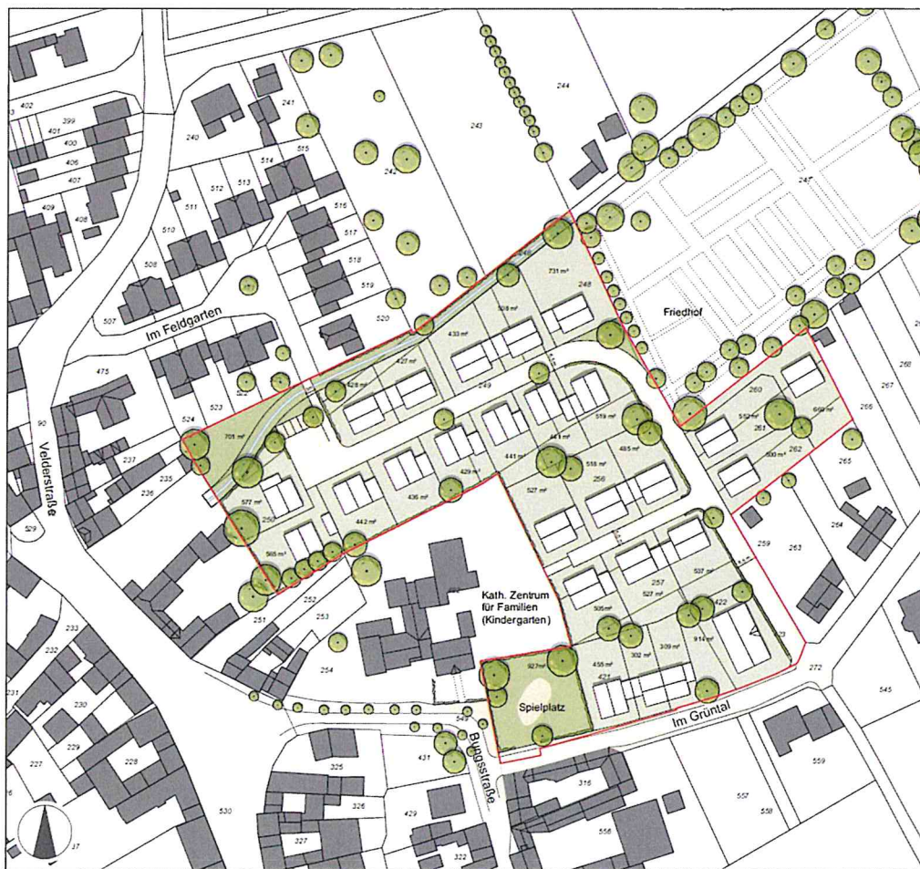
Abb.: Geltungsbereich des Bebauungsplans Titz Nr. 42, Ortslage Titz (o. Maßstab)

Der Geltungsbereich des Bebauungsplanes ist im nachstehenden Planausschnitt dargestellt. Maßgebend ist die Festsetzung des räumlichen Geltungsbereichs gem. § 9 Abs. 7 BauGB im Entwurf des Bebauungsplanes Titz Nr. 42, Ortslage Titz, gelegen im Bereich Im Feldgarten und Im Grüntal.