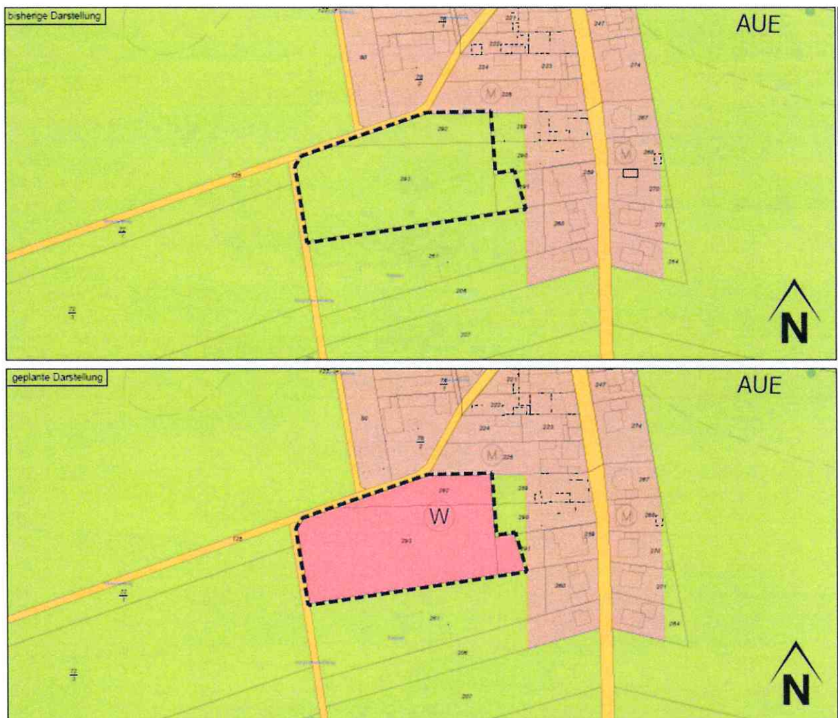
Abb.: Geltungsbereich der 26. Änderung des Flächennutzungsplans, Ortslage Kalrath (VDH Projektmanagement GmbH)

Der Geltungsbereich der 26. Änderung des Flächennutzungsplanes ist in der folgenden Skizze dargestellt: